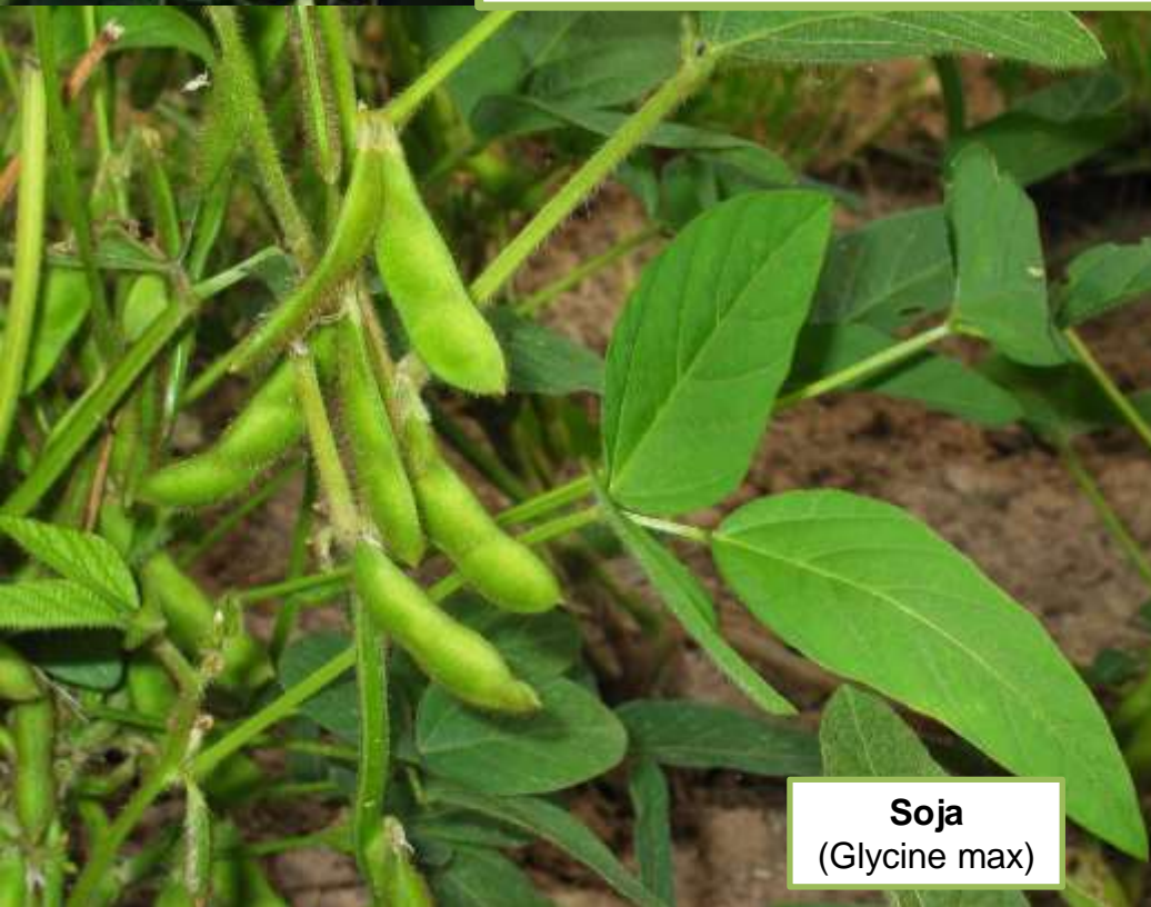
Soja ( Glycine max )