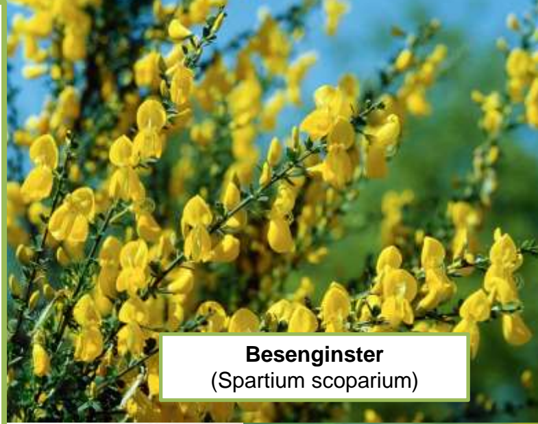
Besenginster ( Spartium scoparium )

Zu den Pflanzenhormonen , auch Phytoestrogene oder Phyto-SERM genannt, gehören – trotz der völlig unterschiedlichen hormonartigen Effekte (!) - im engeren Sinn vor allem: Soja, Rotklee, Ginster, Hopfen und Silberkerze.