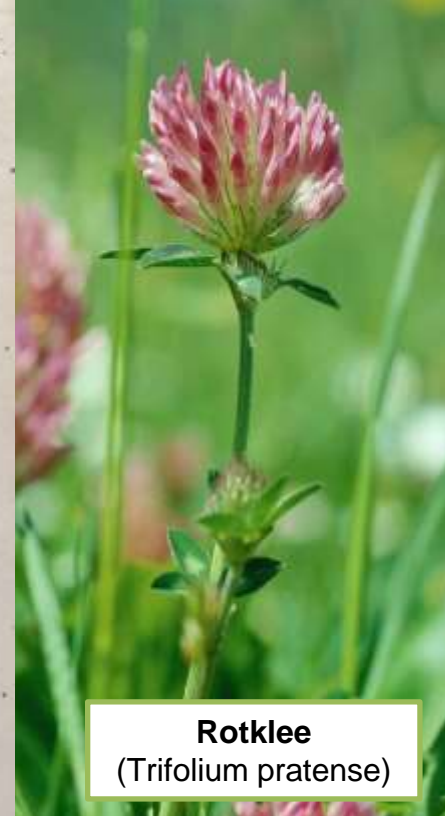
Rotklee ( Trifolium pratense )