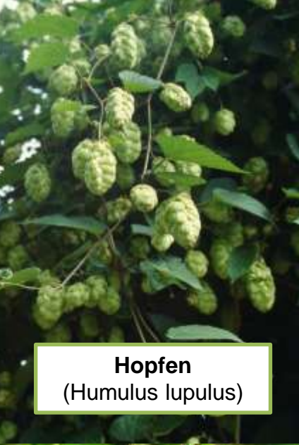
Hopfen ( Humulus lupulus )

Zu den Pflanzenhormonen , auch Phytoestrogene oder Phyto-SERM genannt, gehören – trotz der völlig unterschiedlichen hormonartigen Effekte (!) - im engeren Sinn vor allem: Soja, Rotklee, Ginster, Hopfen und Silberkerze.