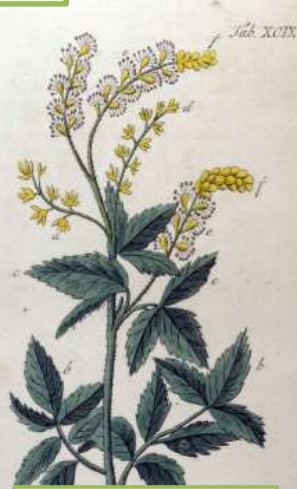
Silberkerze ( Cimicifuga racemosa )